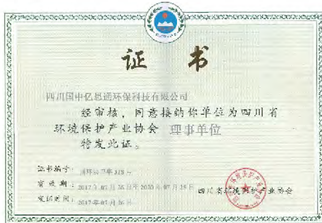
国中水务旗下公司成为环保协会理事单位

2017年，国中水务旗下多家公司被评为行业先进企业。其中，鉴于长期致力于水污染防治，在环保领域取得较大成绩，国中亿思通、青海雄越等公司成为环境保护产业协会理事单位。