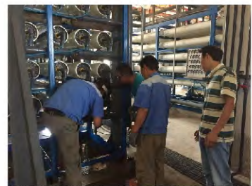
水厂设备升级改造