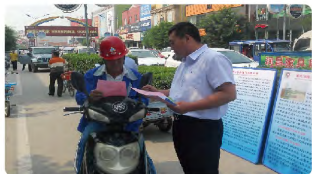
世界环境日活动—人人参与 创建绿色家园