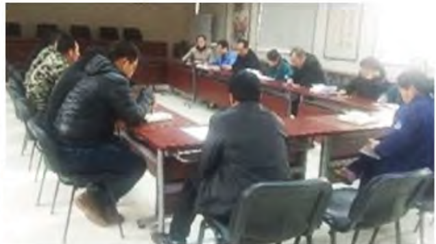
国中水务员工学习“三严三实”