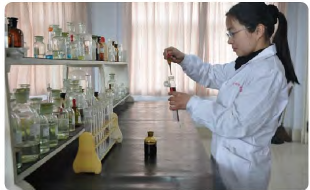
自来水公司水质检测员严格检验确保供水质量