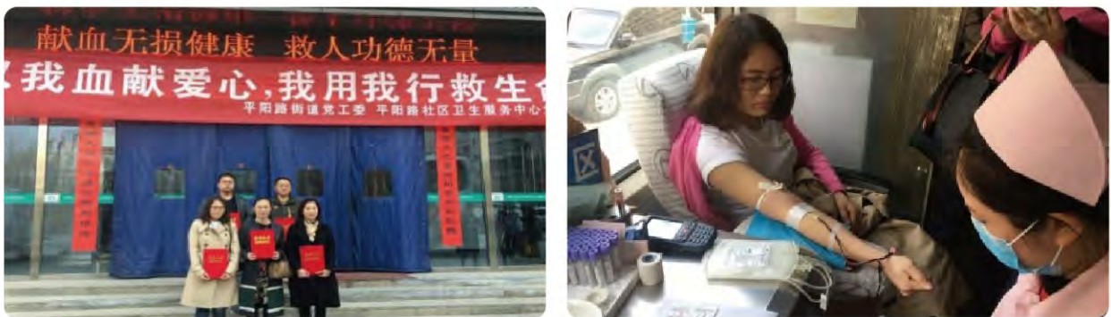
国中水务员工参加义务献血活动

2017年10月，太原豪峰公司员工参加了以“关爱生命、奉献爱心”为主题的义务献血公益活动。此次公益活动由太原平阳路街道党工委、平阳路社区卫生服务中心及驻地单位联合举办。献血员工表示，希望能通过自己的微小举动传递人间温情，凝聚社会正能量，弘扬社会主义核心价值观。