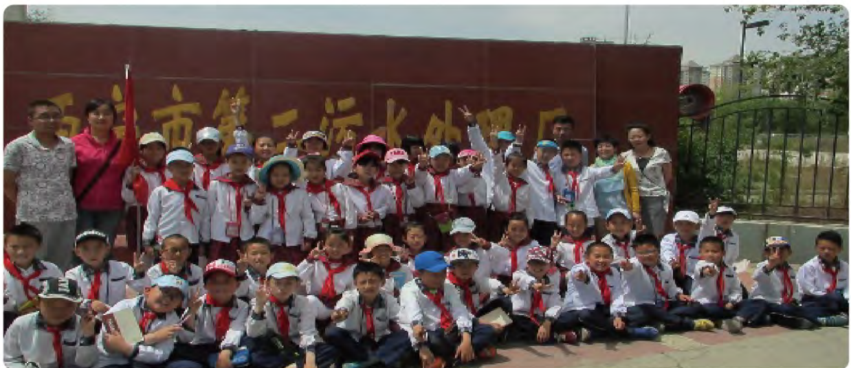
青海雄越公司接待小学师生观摩

随着社会公众环保意识不断增强,宣传环保、践行环保成为了社会的热门话题。作为环保行业的运营者,国中水务注重发挥自身优势,积极参与环保宣传。项目公司常常会接到学校师生来厂参观、学习的要求。国中水务积极配合学校开展环保教育,合理调整运营时间,派出业务骨干现场讲解,认真回答同学们提出的问题,增强了同学们从我做起保护水资源的兴趣和意识。