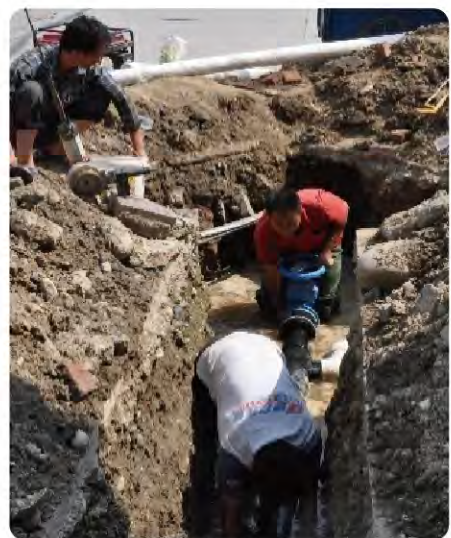
国中水务员工加班加点抢修供水管道

中国城市化进程正在稳步推进，交通基础设施建设仍然是城市建设的重点。国中水务的供排水管网很多都分布在各大道路附近，城建部门对道路的拓宽、维修等工程给管网安全带来了潜在的风险。为了确保管线不被破坏，居民供水不间断，同时又能满足城市建设的需要，项目公司都制定了严密的预防措施，时刻关注市政建设进程。一旦有管线附近的工程，项目公司立刻派出工作人员用标识旗清楚标识管线走向，并主动联系道路施工单位，下发供水管线保护告知书，详细说明管线位置。同时也加强了巡线频次，遇到节假日也安排值班人员对路过桥处实地查看。